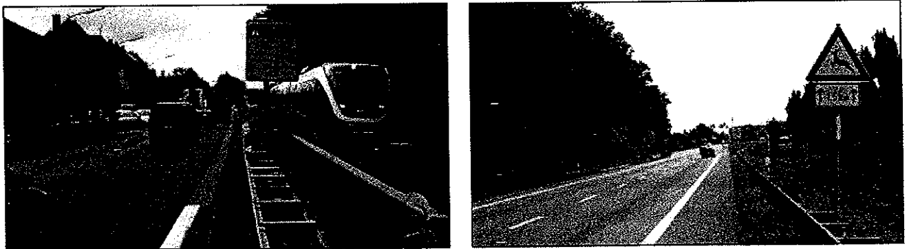
Abbildung 2: Foto der Zählstellen 40154200 (links) in Clarholz und südlich Herzebrock (rechts)

Die Radaranlagen wurden an repräsentativen Normalwerktagen (laut EVE 91) im Juni installiert.